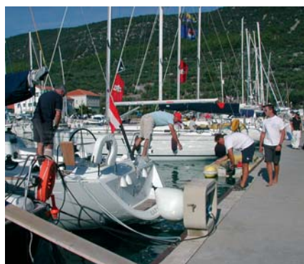
Bilo je radno jučer poslijepodne u creskoj marini